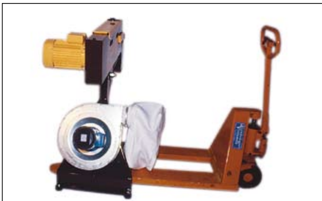
Som extra utrustning kan utsugningsfläkt levereras. Kapacitet 1200 m 3 /h.