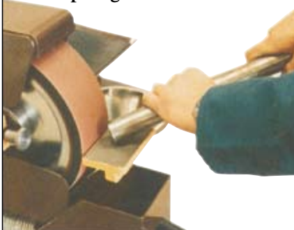
Slipning mot kontaktskiva.

På bilden syns det praktiska anhållet som är demonterbart vid slipning av större detaljer