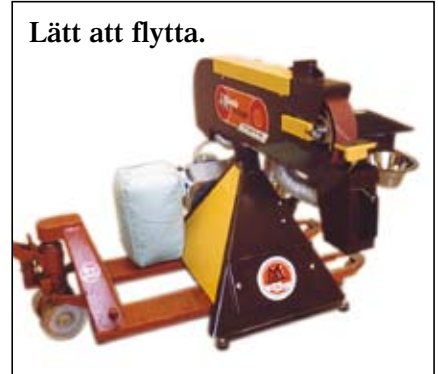
Lätt att flytta.

Bandslipmaskinen Swede-Grinder är en kompakt enhet och den behöver inte bultas fast i golvet. Den står på gummidämpare som minskar vibrationerna och ger tystare gång.