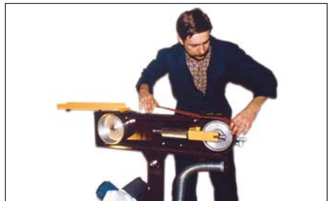
Bandspännaren låses automatiskt i sitt bakre läge, vilket möjliggör enkelt bandbyte.

AB Maskinarbeten i Alvesta grundades 1952. Idag förfogar vi över mer än 25 000 kvadratmeter industrilokaler, en modern maskinpark och duktig personal. Vi utför arbeten som inbegriper avancerad svetsning, plåtbearbetning och maskinbearbetning. Dessutom tillverkar och marknadsför vi även egentillverkade produkter, t ex arbetskorgar, bandslipmaskiner, staplingsbara häckar och insatsfilter.